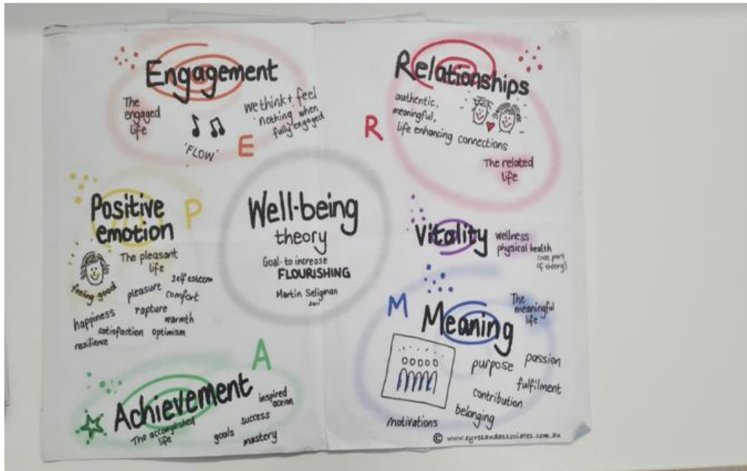
Model PERMA – Well-being Theory (Martin Seligman): Positive Emotion, Engagement, Relationships, Meaning, Achievement