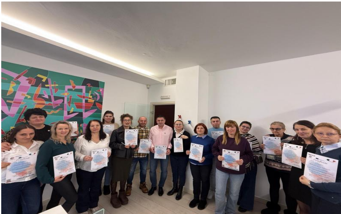
Ceremonia de înmânare a certificatelor Erasmus+ – Torino, 5 Decembrie 2025