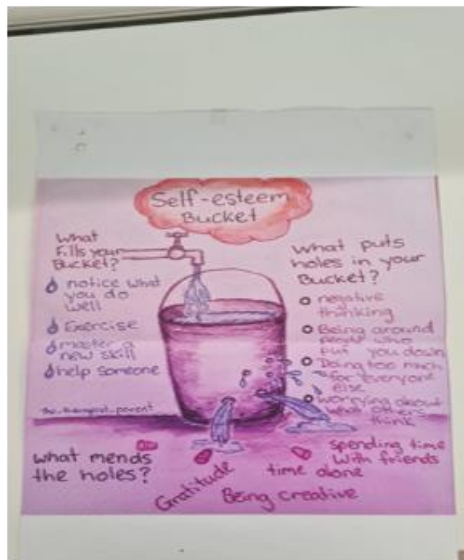
Self-Esteem Bucket – metaforă pentru construirea stimei de sine